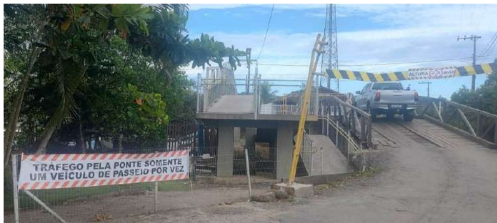
Comunidade acredita que um fiscal durante o dia ajudaria muito no controle e passagem dos veículos.

A prefeitura alerta que os motoristas devem sempre respeitar os limites de peso e carga da ponte e evitar passar se suspeitarem que seu veículo possa exceder esses limites.