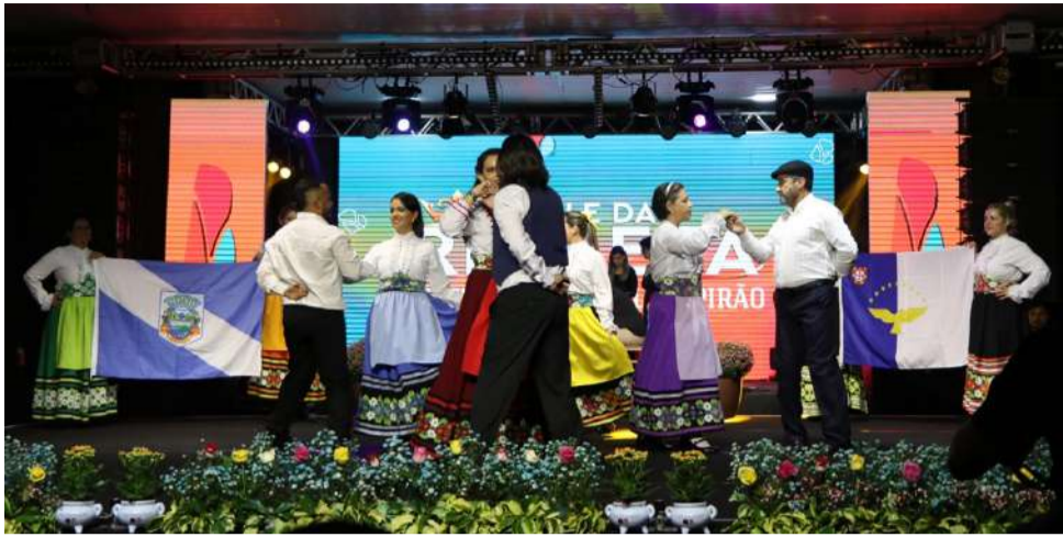
Apresentação do Grupo Folclórico Açoriano