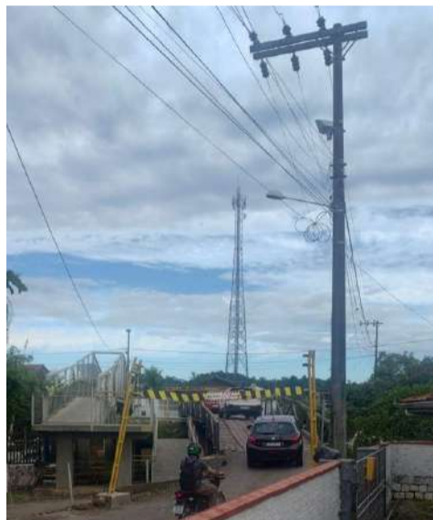
A reportagem flagrou na quarta-feira (26), os veículos não respeitando o aviso e realizando a travessia sem aguardar a passagem individual.

Faixas foram instaladas alertando os motoristas, mas nenhum fiscal foi visto realizando este importante trabalho de monitoramento.