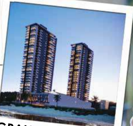
GRANT HOME CLUB FRENTE MAR - PRAIA DO TABULEIRO