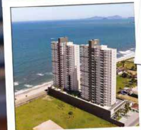
BARRA VIEW FRENTE MAR - PRAIA DO TABULEIRO