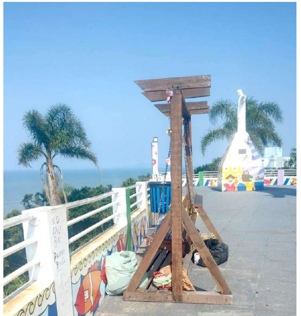
No dia do registro, bolsas com roupas dos moradores de rua foram flagradas no local.