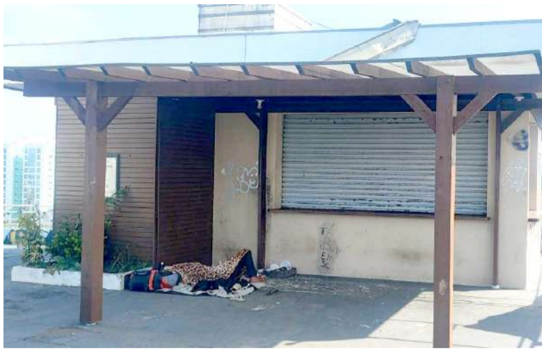
No dia do registro dessa foto, haviam outros dois homens embaixo da imagem do Cristo interdita pela Defesa Civil.